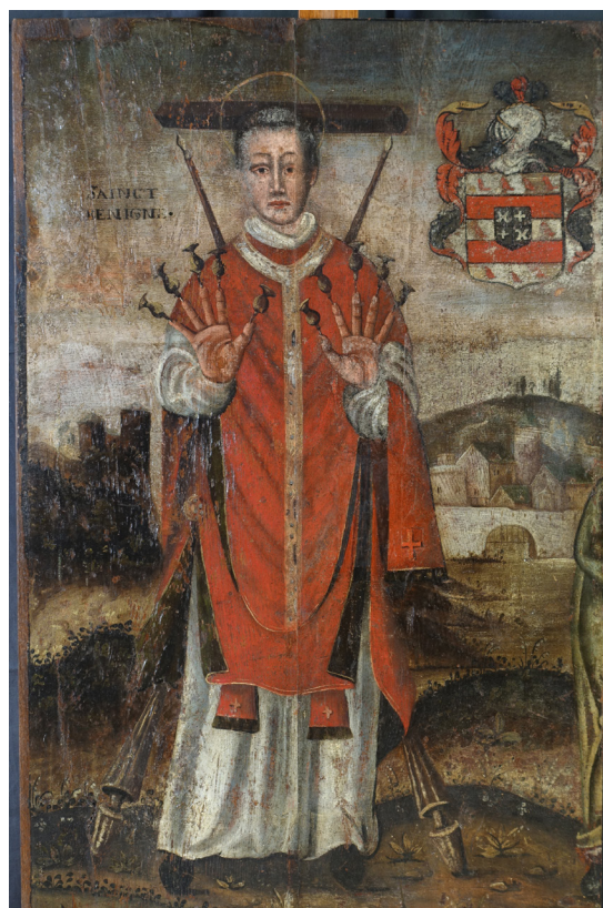
Anonyme français, Volet de polyptyque représentant saint Bénigne , Quatrième quart du XVI e siècle, peinture sur bois, D 980.1.33.1

Toute l'année, l'accès au musée et à l'exposition est libre et gratuit.