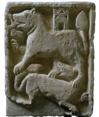
Bas-relief aux lions, Première moitié du XI e siècle, calcaire, Arb. 1129