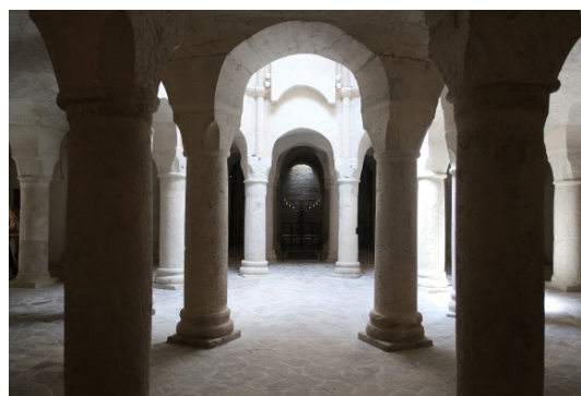
Vue de la rotonde