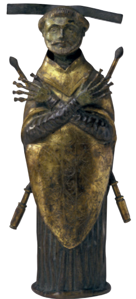
Partie de bâton cantoral représentant saint Bénigne Seconde moitié du XV e siècle, cuivre doré repoussé, Arb. 1376

À chacune et chacun de nos visiteurs, nous souhaitons que la salle du dortoir, écrin somptueux du musée archéologique de Dijon soit le lieu d'explorations inédites et enrichissantes de l'abbaye de Saint-Bénigne et de sa rotonde, à travers le temps et l'espace.