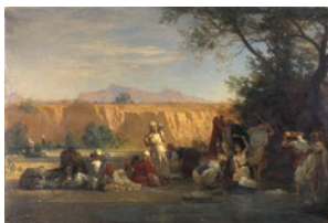
Gustave Guillaumet Femmes du Douar à la rivière, 1872

Transfert de l'Etat à la Ville de Dijon : Paris, Centre National des arts plastiques. Mention obligatoire : Dépôt de l'Etat de 1874, transfert définitif de propriété à la Ville de Dijon, arrêté du Ministre de la Culture du 15 septembre 2010.