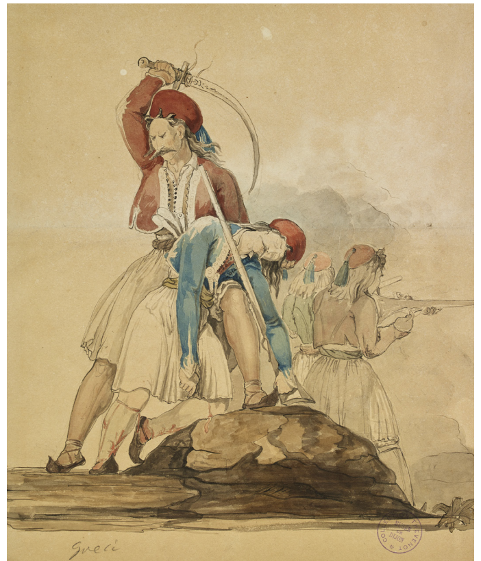
Anonyme, Soldats enturbannés , début du XIX e siècle

Ils accompagnent délégations diplomatiques, expéditions militaires ou scientifiques, munis de leurs carnets de croquis, leurs plumes et leurs outils d'aquarellistes. Le milieu militaire, diplomatique et les guerres constituent donc l'une des premières sources de représentation des artistes voyageurs. Le temps du voyage est celui de l'aventure et de la collecte d'images, tandis que les peintures sont souvent composées au retour à Paris, dans l'atelier. Les artistes revisitent l'épisode militaire à la manière de la peinture d'Histoire, en mettant en scène des figures de guerriers en armes, de cavaliers à l'assaut, des démonstrations militaires.