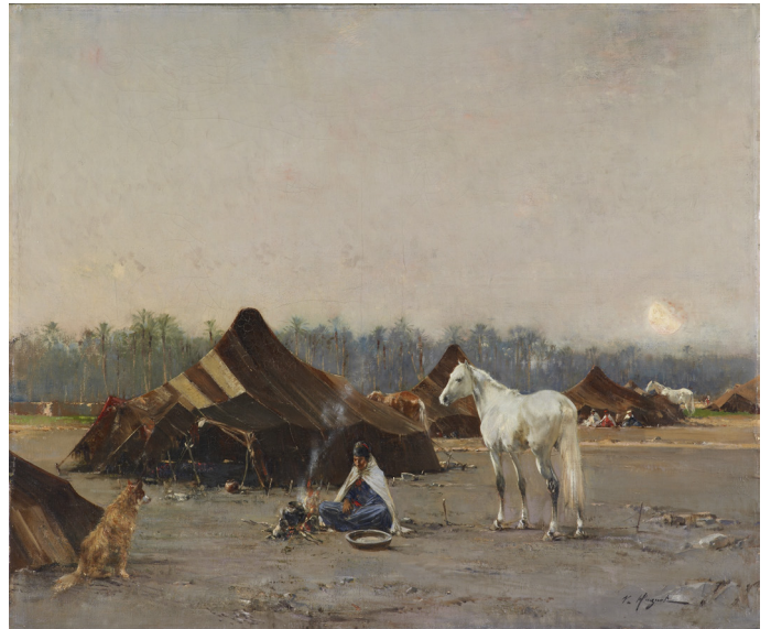
Victor-Pierre Hugué, Campement à Biskra , XIX e siècle

À l'origine, l'adjectif «pittoresque» avait à peu près la même signification que «pictural», ce qui est digne d'être peint, d'être représenté. Puis le Romantisme utilise le mot «pittoresque» pour désigner ce qui est en opposition à la beauté classique, rationnelle, géométrique, régulière, en un mot la Nature humanisée et maîtrisée. Il équivaut aussi à ce qui est original, insolite, rejoignant ainsi la définition d'«exotique». Le Romantisme et par là même l'Orientalisme, va se passionner pour des scènes grandiloquentes et sublimes de la nature, les grands espaces, les étendues immenses arides et sauvages, les paysages grandioses