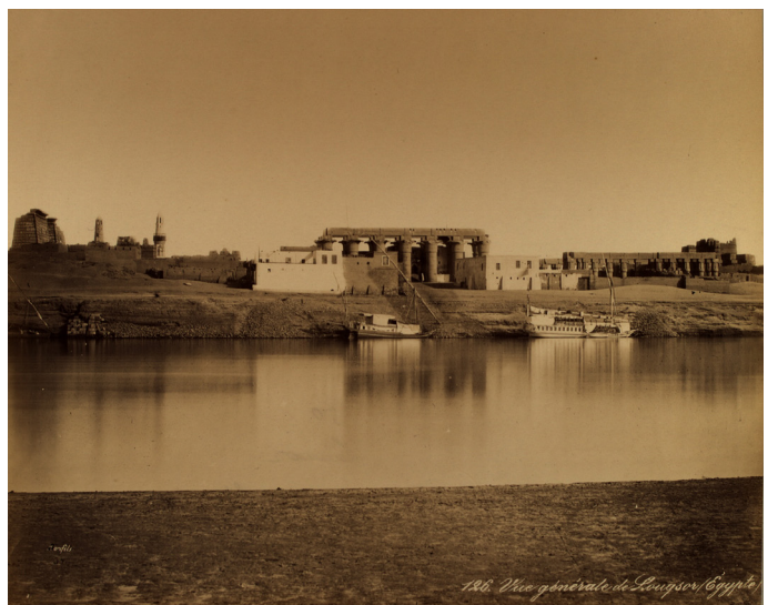
Félix Bonfils, Vue générale de Louksor , vers 1880 prêt du musée Nicéphore Niépce, Chalon-sur-Saône