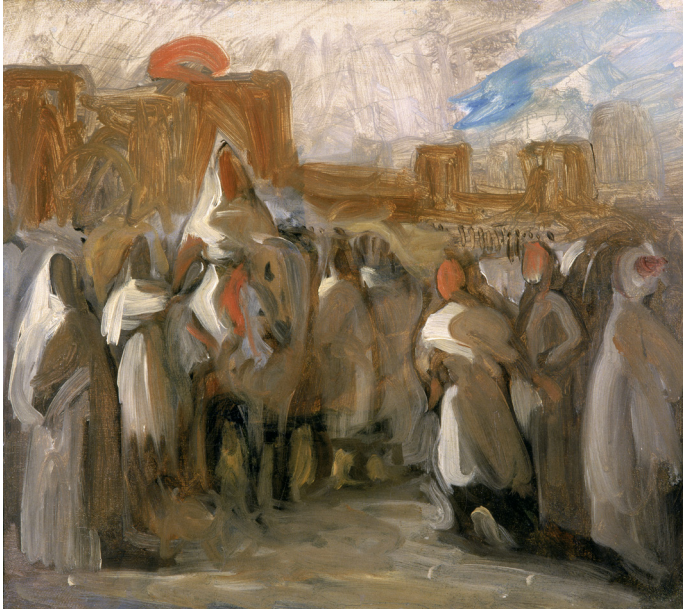
Eugène Delacroix, Le Sultan du Maroc Mulay Abd-Er-Rahman recevant le comte de Mornay, ambassadeur de France , esquisse vers 1832