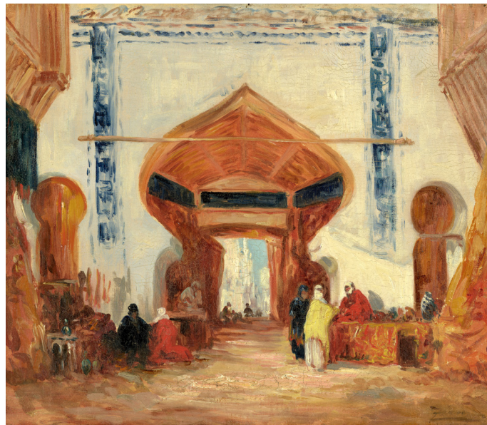
Félix Ziem, Le marchand de tapis , deuxième moitié du XIX e siècle

Les peintres orientalistes sont conquis par cette architecture composée de volumes simples : parallélépipèdes, rectangles ou cubes surmontés de demi-sphères, les dômes, les colonnes cylindriques ornées ou piliers maçonnés carrés, rectangulaires ou cruciformes, mais aussi par les arcs persans, les arcs polylobés, les arcs outrepassés ou en fer à cheval, les moucharabiehs et fenêtres à jalousies, les éléments