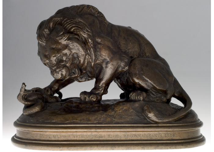
Antoine-Louis Barye, Lion au serpent, vers 1845

Chez le sculpteur Antoine-Louis Barye, qui n'a jamais voyagé en Orient mais prenait pour modèle les animaux du Jardin des Plantes, l'animal d'Orient représente l'énergie primitive, la sauvagerie, dans une vision fantasmée et romantique de la faune exotique. Ses lions, tigres et jaguars sont représentés en plein élan carnassier, muscles proéminents, pelage frémissant, toutes griffes dehors.