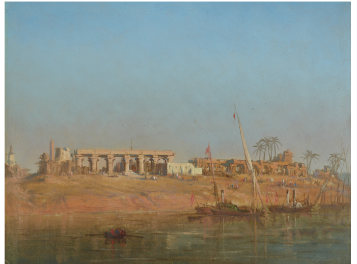
François-Pierre-Bernard Barry, Ruines des Temples de Thèbes, Louksor , deuxième moitié du XIX e siècle