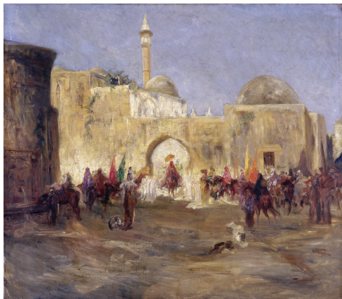
Jean-Joseph Benjamin-Constant, La sortie de la mosquée , vers 1872

La visite peut s'inscrire dans une réflexion sur le voyage, le dépaysement, l'ailleurs. Un relevé et une analyse d'éléments iconographiques et plastiques révélant cette quête de sujets (l'architecture et le paysage, le pittoresque...) et d'un climat nouveaux permettent de prendre conscience des aspirations au renouvellement des artistes du XIX e siècle entre traditions et ruptures. La visite peut être replacée dans le cadre d'une thématique plus large consacrée à l'opposition «rêve/réalité». Elle peut constituer l'amorce d'une réflexion sur le rapport, entre le reportage et l'expression d'une interprétation purement subjective.