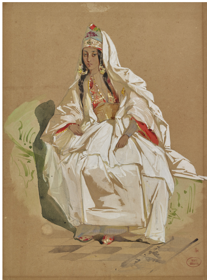
Eugène Giraud, Orientale , XIX e siècle

Le harem semble être un lieu créé de toutes pièces pour que les mythes, les fantasmes et les réalités s'enchevêtrent et incarnent les songeries voluptueuses, les rêveries poétiques, exotiques et érotiques d'un Occident vêtu de noir, chapeauté ou corseté marqué par le sceau de la monogamie.