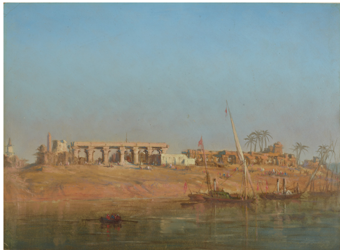
François-Pierre-Bernard Barry, Ruines des Temples de Thèbes, Louksor , deuxième moitié du XIX e siècle