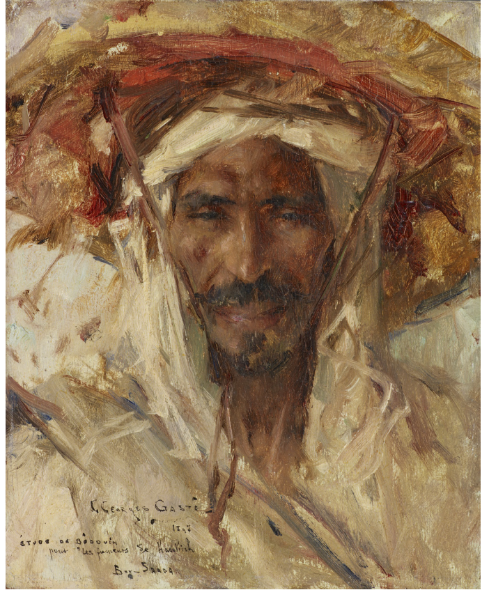
Constant-Georges Gasté, Portrait de bédouin , 1897

Après 1840, les voyageurs en Orient se munissent du matériel du photographe et s'attachent aussi à rendre compte d'un Orient authentique, mettant en scène ses populations dans une recherche à mi-chemin entre le reportage documentaire ethnographique et la carte postale souvenir. Les photographes européens s'installent sur place et ouvrent des studios permettant des mises en scènes audacieuses, tentant de saisir des instantanés.