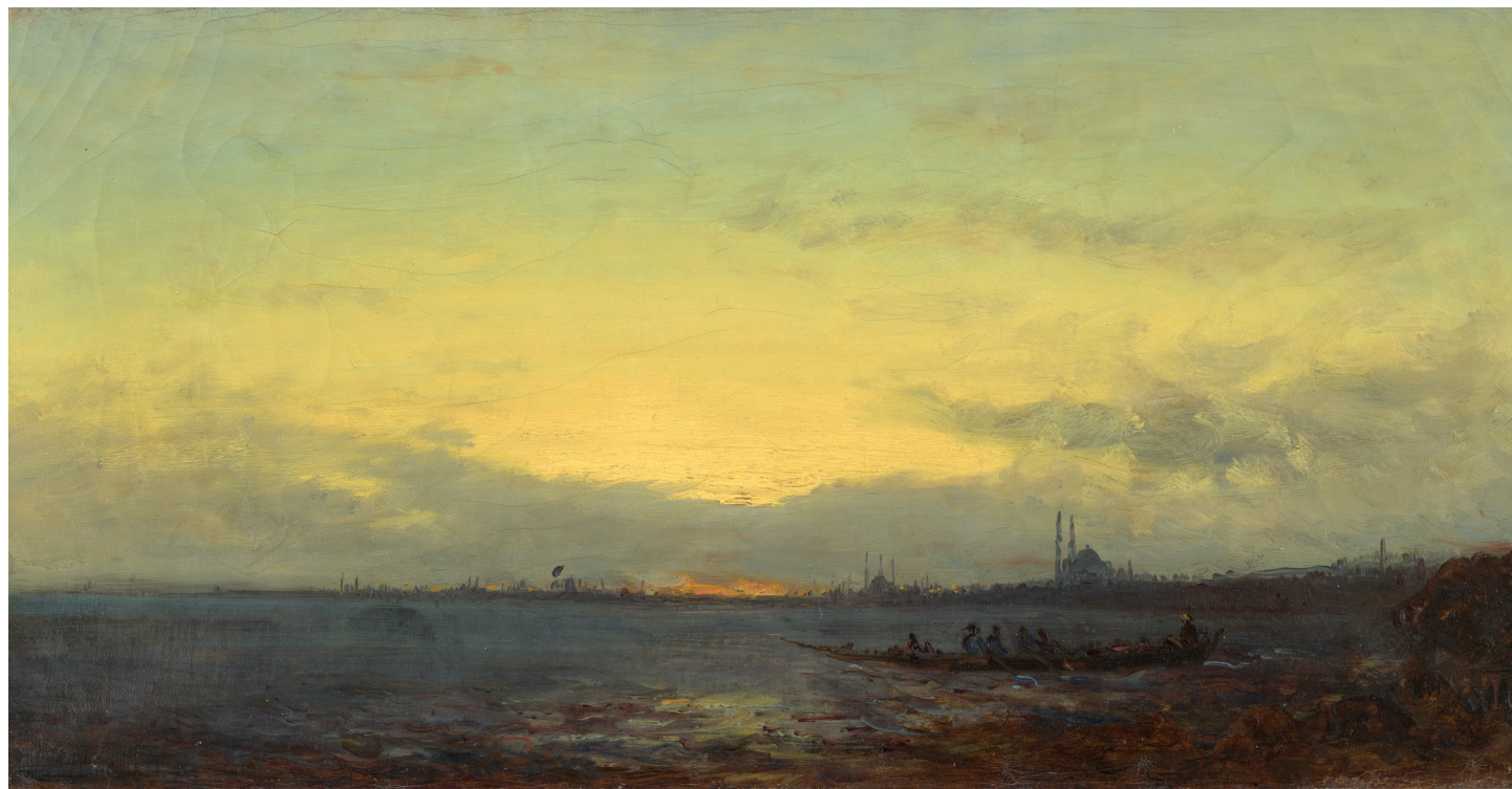
Félix Ziem, Stamboul , XIX e siècle