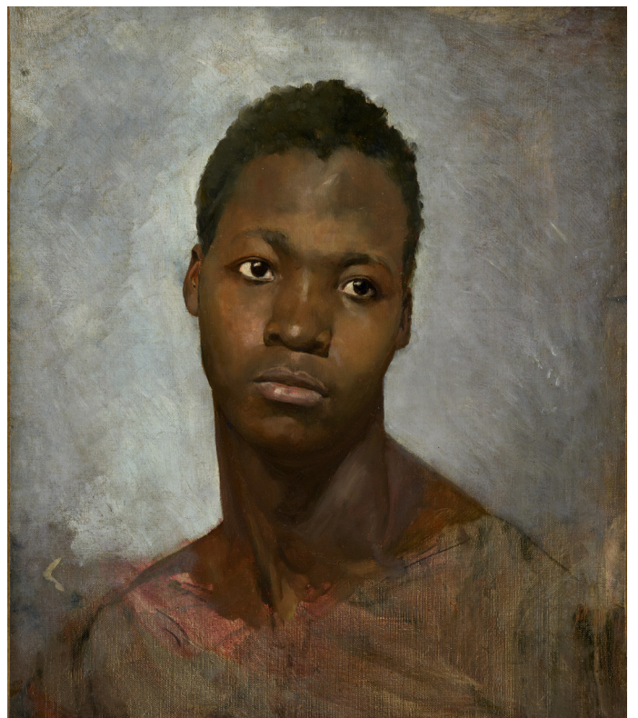
Henri Regnault, Portrait dit « Tête de Nègre », vers 1869-1871